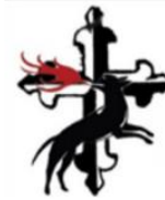
Fraternidad Laical Dominica Santa Catalina de Siena El Seibo - Rep. Dominicana