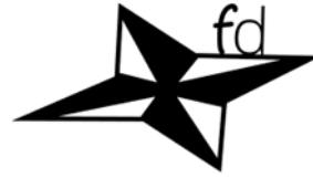
Familia Dominicana España